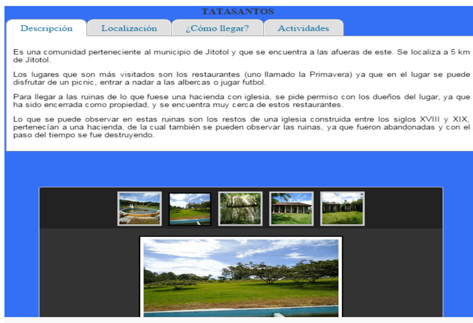
Figura 1. Ficha informativa del sitio turístico permanente “Tatasantos”.

La estructura de la ficha turística incluye descripción, localización, cómo llegar, actividades y galería fotográfica.