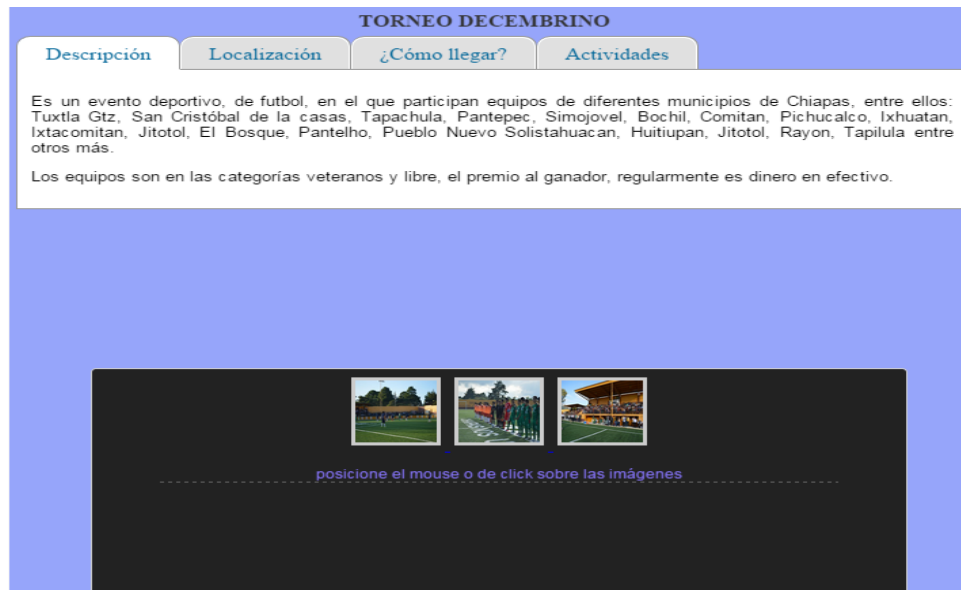
Figura 2. Ficha informativa del sitio turístico temporal “Torneo decembrino”.